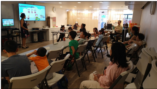
CD101 趣味中文初级班 Children's Chinese Language Class