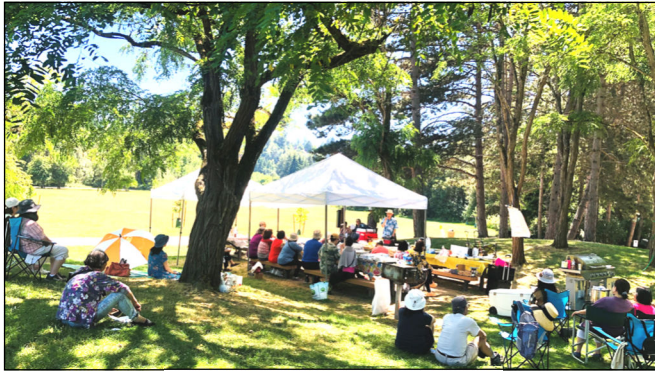
福乐小组 野餐聚会 Blessed Group Picnic at Luther Burbank Park