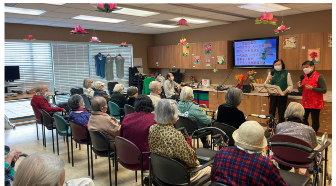
喜讯布道队到健安安老院及松柏楼布道探访 Cantonese Opera Outreach Visits at Kin On Assisted Living & Legacy House