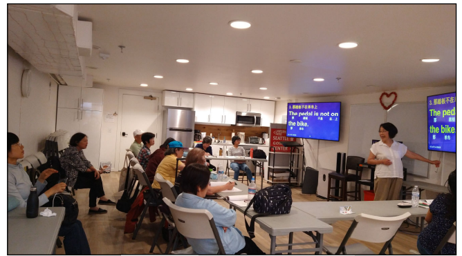
ENG227 英文发音班 English Phonics Class