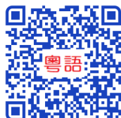
粵語課程 Cantonese Classes