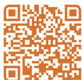
國語課程 Mandarin Classes