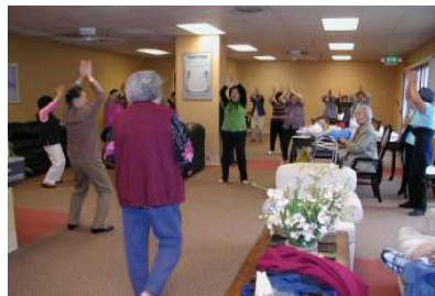
(圖) 老人運動及查經班

喜訊福音粵曲團契： 每週六上午10:00聚會，平均有十一人參加。除每季一次到松柏樓佈道外，團契也有到教會英文班和福樂團契分享，藉福音粵曲去為主作見證，又參與唐人街擺攤的佈道工作。合唱粵曲真不是一件容易