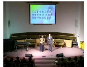
(圖) 福音粵曲分享會

值得一提的是，聚會在晚上七時半才開始，但是六時正已有一位中年女士陪同她年邁的母親來到等候入場。傾談之下，才知道原來她們未能取得門票，但是她們真的很希望參加聚會，於是前來試試看。在場有位姊妹知道後，立即讓出她的兩張門票，叫這對未認識主的母女如願進場。雖只是小事一樁，卻是愛主的一個好見證。(轉下頁)