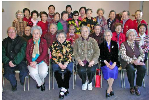
(圖) 老人運動及查經班

『神愛世人，甚至將他的獨生子賜給他們，叫一切信他的，不至滅亡，反得永生。』（約翰福音 3:16）※