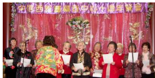
(圖) 老人運動及查經班

大概十一年前，我來到西雅圖，有機會向弟兄姊妹作出這個挑戰：西雅圖有這麼多華人的靈魂，責任在誰人的身上？誰向他們傳福音？您是否希望有西人宣教士來跟他們傳福音？有沒有想過為什麼今天您會住在西雅圖？神為何安排您在這裡？原來，當您住在西雅圖的時候，神就把西雅圖華人靈魂的責任放在您的身上。當然您可以出去傳福音，我們各人都應該去傳福音，但是弟兄姊妹怎樣可以同心協力，更有效地傳福音呢？如果西雅圖沒有一個福音中心的話，您當然可以自己在街上派單張、傳福音。但是，如果有一個福音中心，就不單您自己一個人可以這樣做，您可以跟一班同蒙天召的弟兄姊妹組成團隊，更有效地傳福音。福音中心設有英文班、粵曲團契、及許多不同的事工。如果沒有福音中心，就沒有這麼容易去吸引人來聽福音。(轉下頁)