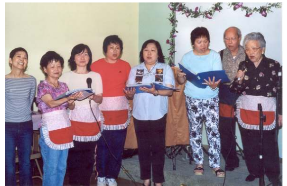
(圖)頌夏夜卡拉OK晚會

■頌夏夜卡拉OK晚會：由粵曲團契主辦，六月十一日及七月十六日在福音中心舉行，節目包括短劇及卡拉OK，平均有廿三人參加。尚有一次聚會於八月十三日晚上六時在福音中心舉行，歡迎大家邀請親友一同參加。