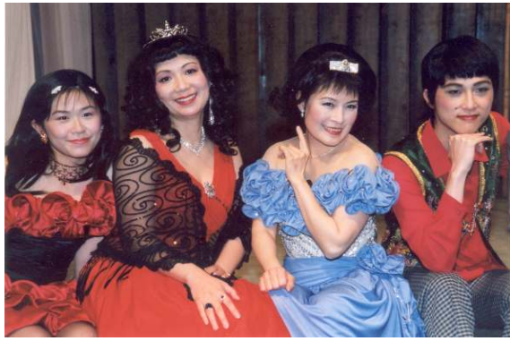
(圖)「愛在當天有個約會」歌劇佈道會