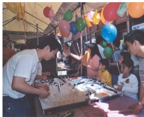
(圖) 電動車迷宮： 尋找生命中最大的寶藏—耶穌基督