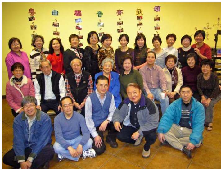
(圖) 粵曲團契十週年感恩餐會

雖然福音中心只有一位同工，但是神祝福我們有多位愛主愛人的董事和義工，當中有好幾位更是從起初便