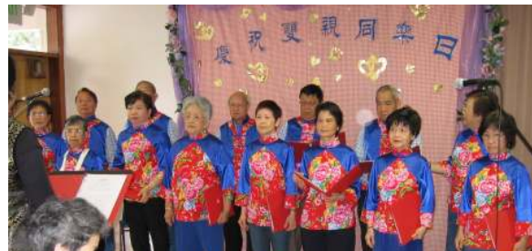
(圖) 喜訊福音粵曲團契

喜訊福音粵曲團契： 由本地眾教會弟兄姊妹組成，藉福音粵曲去傳揚福音。每週六上午 10:00 聚會，一起練習唱粵曲詩歌，又有靈修分享，彼此扶持，預備為主作見證，平均十四人參加。另