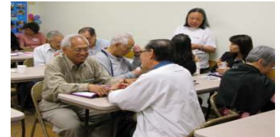
學員們熱烈學佈道