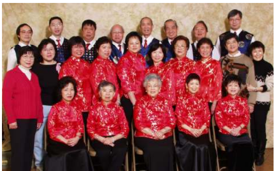
二零零五年大合照