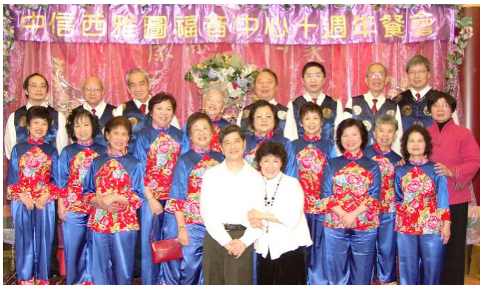
二零零七年大合照