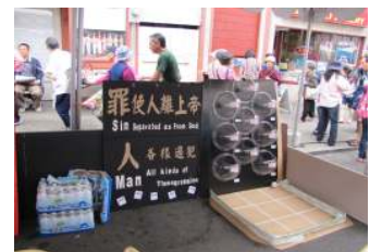
「生命更生」福音攤位

◎ 強風亂陣 ◎ 狂風怒刮，至使我們福音中心原先為攤位所預備的，要懸掛起來有關救恩訊息的佈置(見下圖)全不能高掛起來，那怎麼辦呢？唯有搬出一些長桌子，把它們橫向倒放在地上，利用桌面作靠背，就把要懸掛的全部貼在桌面上，那就不怕風吹了。本來應該高舉傳揚福音的標語被迫全貼在僅離地三尺高的桌面，令活動進行時每人都要低下頭來向下看。如此看來惡勢力