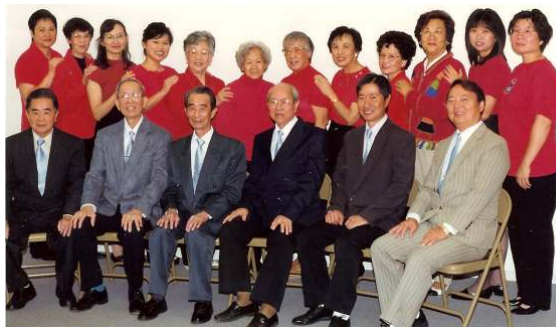
一九九八年大合照

喜訊福音粵曲團契成立於1997年9月，是本中心最早成立的團契。它與福音中心同步成長，不知不覺已十五年之久，真感謝主的恩典。顧名思義，團契的宗旨是用福音粵曲去傳揚主的佳音。現今團契有十多位成員，是分別來自本地五間教會，就是華人浸信會、華人美南浸信會、東區護道堂、宏恩華人宣道會和西雅圖華人宣道會。團契定時每週星期六早上十一時在中心練習，亦定時探訪松柏樓的耆老，平中也會到其他教會和有需要的地方傳福音。