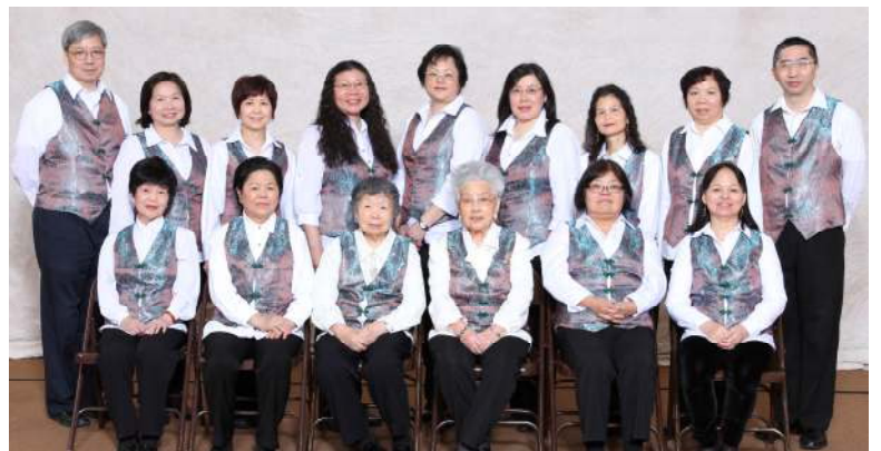
二零一二年大合照