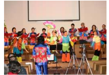
與宏恩舞蹈組出隊佈道

圖片可以作歷史見證，可讓歲月留痕，可緬懷過去，但重要的是可以有跡可循。從左面順年份的圖片得以見到差不多五年一代的團員的情影，又可以見到團員十五年來服裝的演變，從中更見該團契的團結合一，組織有序。而右面圖片則見團員傳福音不遺餘力，除唱腔外更粉墨登場，演唱造手俱佳。雖然對照十五年聚餐的圖片可以見到人事的變遷，但主恩不變，感謝主的眷顧，不斷引領新人加入，讓粵曲團契歷久不衰。粵曲團契是向外開放的，凡喜愛粵曲，又願意認識基督福音者，無任歡迎。