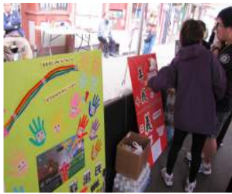
「生命更生」福音攤位

似得逞，但感謝主！到我們攤位參加活動的人仍然很多，然而可惜的是因人手分配的調動，再加上某崗位的同工也在擺攤前兩天亦因工作受傷，故未能全時間予以協助，於是當多人前來攤位參加活動時，令未有經驗的工作人員有應接不暇之勢，至使攤位活動的效果未如預期所想。