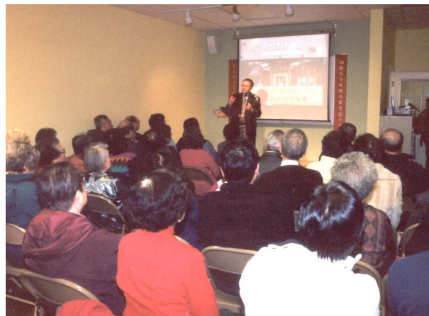
(圖) 重新啓用感恩聚會

這究竟是甚麼意思呢？就是說，我們實在不能以有人信主為滿足。雖然我們須知道每一個靈魂都是主所寶貴的；也唯有聖靈動工，人才得救。但我的禱告是，希望不但不斷有人信主，更希望信主的人能興起以生命影響整個社區，特別在這唐人街，無論是華人或非華人，都不能否認基督耶穌福音的大能與果效。然而，要帶來這樣的改變和果效，卻非中信福音中心獨力能作，也不是單單唐人街的教會可為，乃是整個西雅圖眾教會合力的成果。（轉下頁）