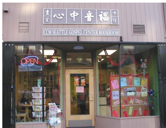
(圖) 中信西雅圖福音中心

感謝主，西雅圖福音中心的目標一向非常清晰：我們不是教會，我們乃是服侍教會的；這個目標是肯定的！不但如此，中心位於唐人街，更肯定了它福音使命的重點： 把福音傳給唐人街一帶的人，即基層人士，也包括基層人士的家人——他們不少是較新的移民。 因著基層的背景和新移民的原故，他們都有特別的需要，甚至急需，對福音的回應，就與一般教會的會眾不一樣了。