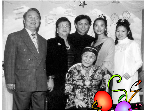
(圖) 有耶穌基督的愛，三代同堂就更蒙福！